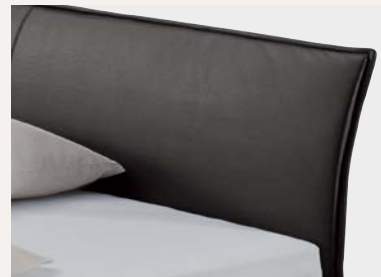
Gebogene Lehne mit Husse