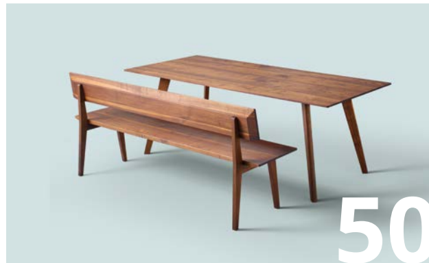
MARTO &amp; PLACE