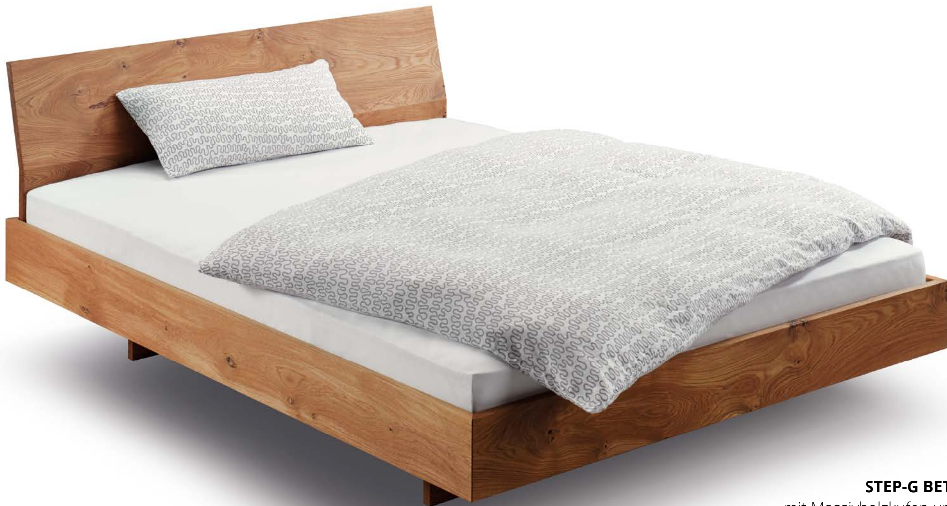
STEP-G BETT mit Massivholzkufen und gewinkelter Massivholz-Rückenlehne Wildeiche