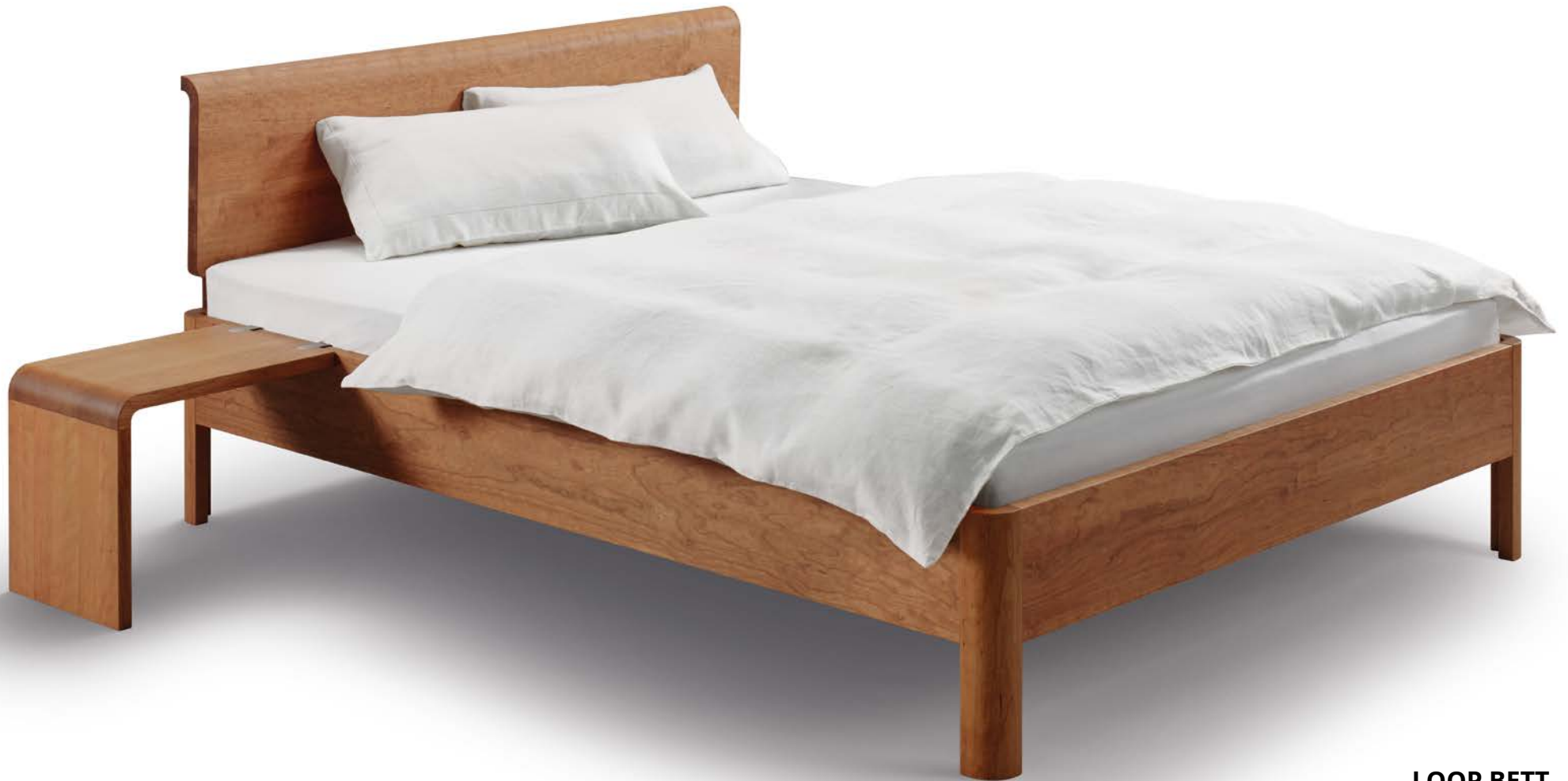
LOOP BETT mit Einhänge-Nachttisch LOOP Cherry