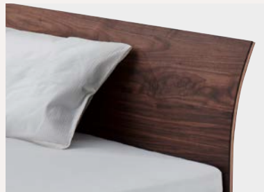
Formverleimte gebogene Rückenlehne