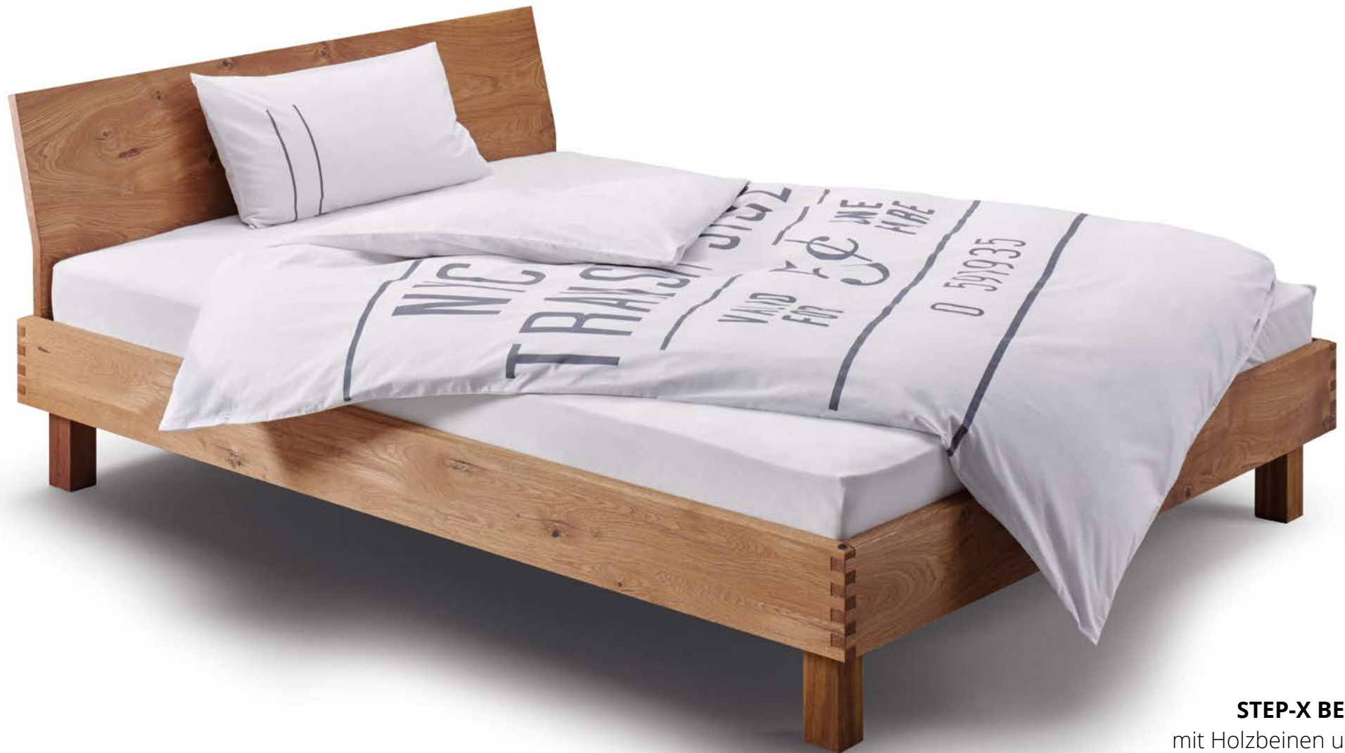
STEP-X BETT mit Holzbeinen und gewinkelter Rückenlehne Wildecke