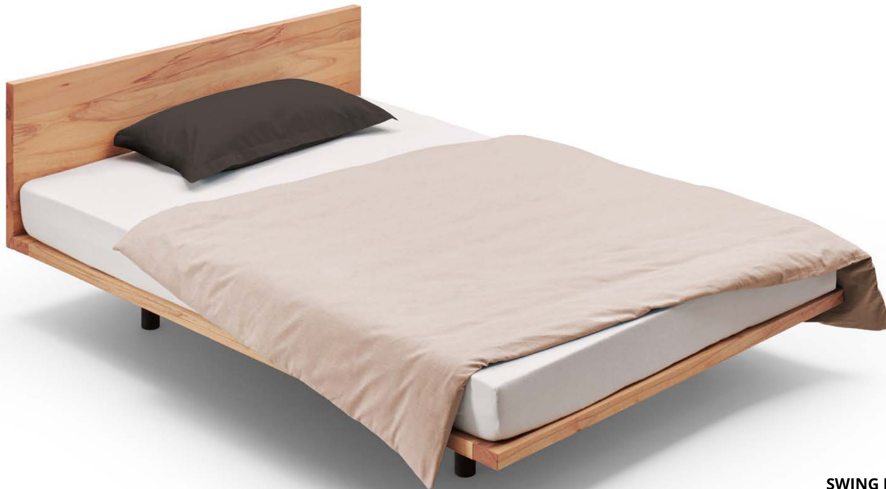
SWING BETT mit Holzrückenlehne Kernbuche