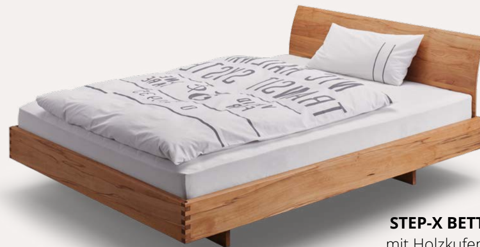
STEP-X BETT mit Holzkufen und gebogener Rückenlehne Kernbuche

Die Perfektion und das Finish unserer Zinkung kann nur mit Sorgfalt und von Hand erreicht werden.