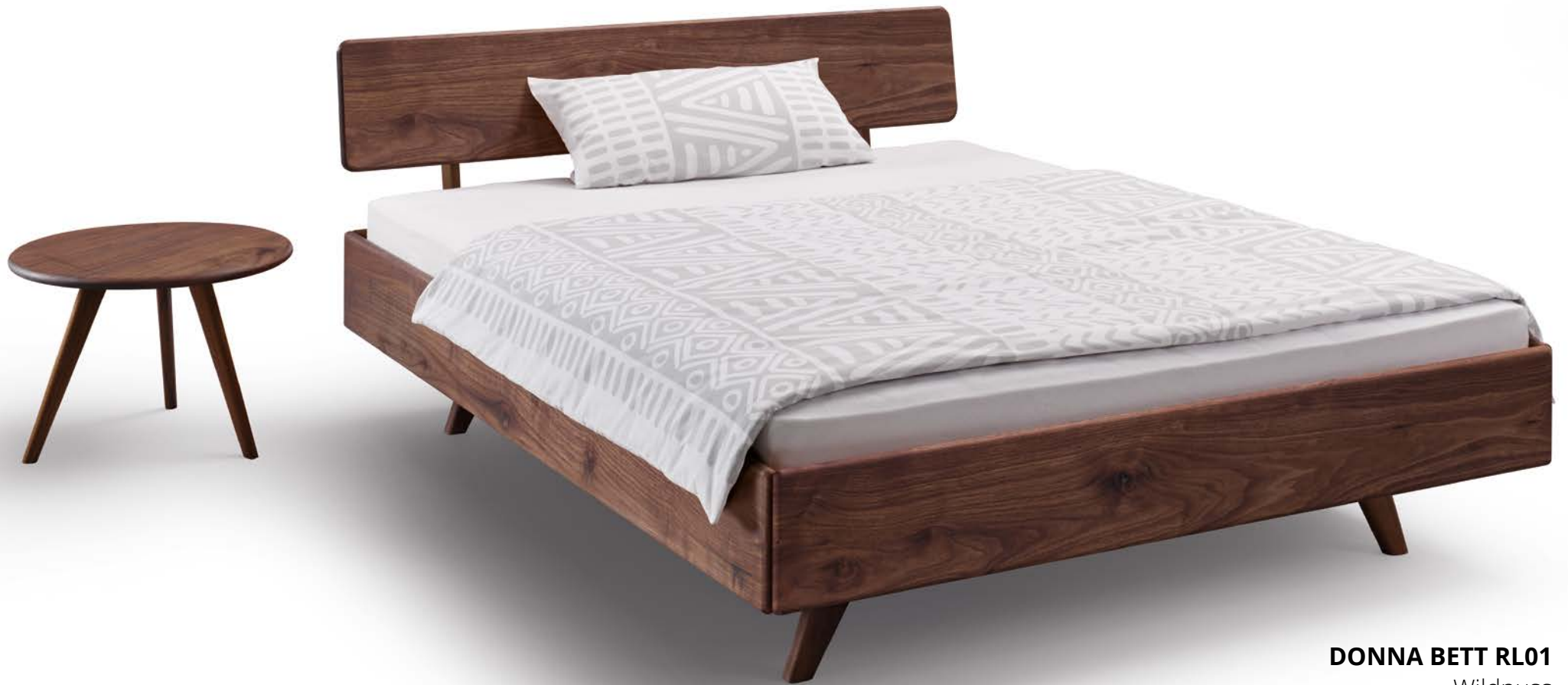
DONNA BETT RL01 Wildnuss