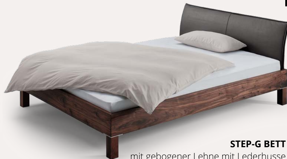
STEP-G BETT mit gebogener Lehne mit Lederhülle und Holzbeinen mit Edelstahlplatten Nussbaum

EXTRAVAGANT. Edelstahlkufen verleihen Ihrem STEP-G Bett eine einmalige Optik.