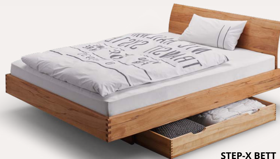
STEP-X BETT mit Holzkufen, Bettkasten und gebogener Rückenlehne Kernbuche