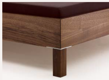
Holzbeine mit Edelstahlplatten