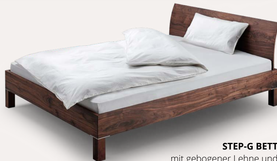
STEP-G BETT mit gebogener Lehne und Holzbeinen mit Edelstahlplatten Nussbaum